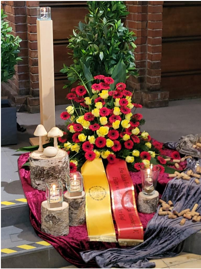
Der Kranz der Weinbruderschaft